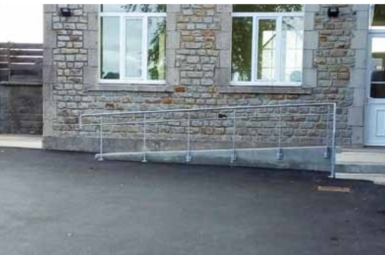
Accessibilité des écoles

Par ailleurs, le programme d'entretien des voiries et voies communales continue. En 2018 vingt chaussées ont fait l'objet d'entretien sur les communes de : Montgardon, Bolleville, Mobeccq, Saint Rémy des Landes et La Haye du Puits.